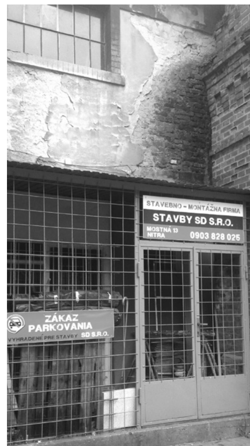
Sídlo firmy STAVBY SD, s. r. o., ktorá realizovala opravy havárií pre BSK

Informácia, aké firmy realizovali tieto opravy, patrí k tým najšokujúcejším. Vo väčšine prípadov ide o tzv. schránkové firmy alebo firmy, ktoré podľa obchodného registra nemali v predmete svojej podnikateľskej činnosti uvedené stavebné práce alebo služby, na ktoré zneli objednávky BSK! Ide