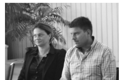
Stretnutie v dennom centre seniorov na Gaštanovej ulici

možnosť spoznať političku, ktorá sa nebojí chodiť medzi ľudí a ktorá má jasný program pre rozvoj Bratislavy a Bratislavského kraja.