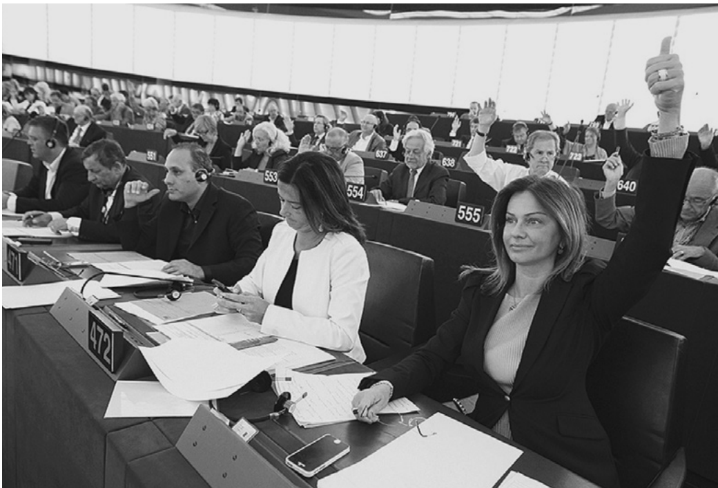
Monika Flašíková-Beňová pri hlasovaní v Európskom parlamente