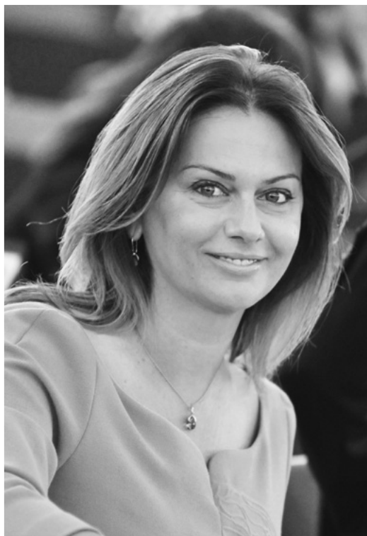
Monika Flašíková-Beňová, europoslankyňa, kandidátka na predsedníčku Bratislavskeho samosprávneho kraja

S Monikou Flašíkovou-Beňovou sa poznám už niekoľko rokov. Sledujem jej prácu v Európskom parlamente, kde sa stala piatou najaktívnejšou poslankyňou. To o nej málokto vie. Rovnako ako to, že pre Slovensko vybojovala zvýšenie objemu eurofondov alebo finančnú pomoc po kalamite vo Vysokých Tatrách. Ja by som vám ju rád predstavil ako ženu a političku, ktorá sa rozhodla kandidovať v blížiacich sa komunálnych voľbách na post predsedníčky Bratislavskej župy. S jasnou víziou a programom.